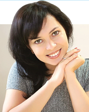
Дизайнеру понравилось заведение

Также, по словам дизайнера интерьеров, бело-красно-черная цветовая гамма не смотрится агрессивной, а больше – стильной и молодежной.